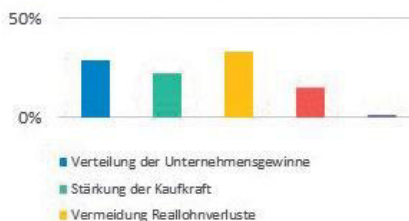
Was ist Dir besonders wichtig bei der Höhe der Forderung 2022?